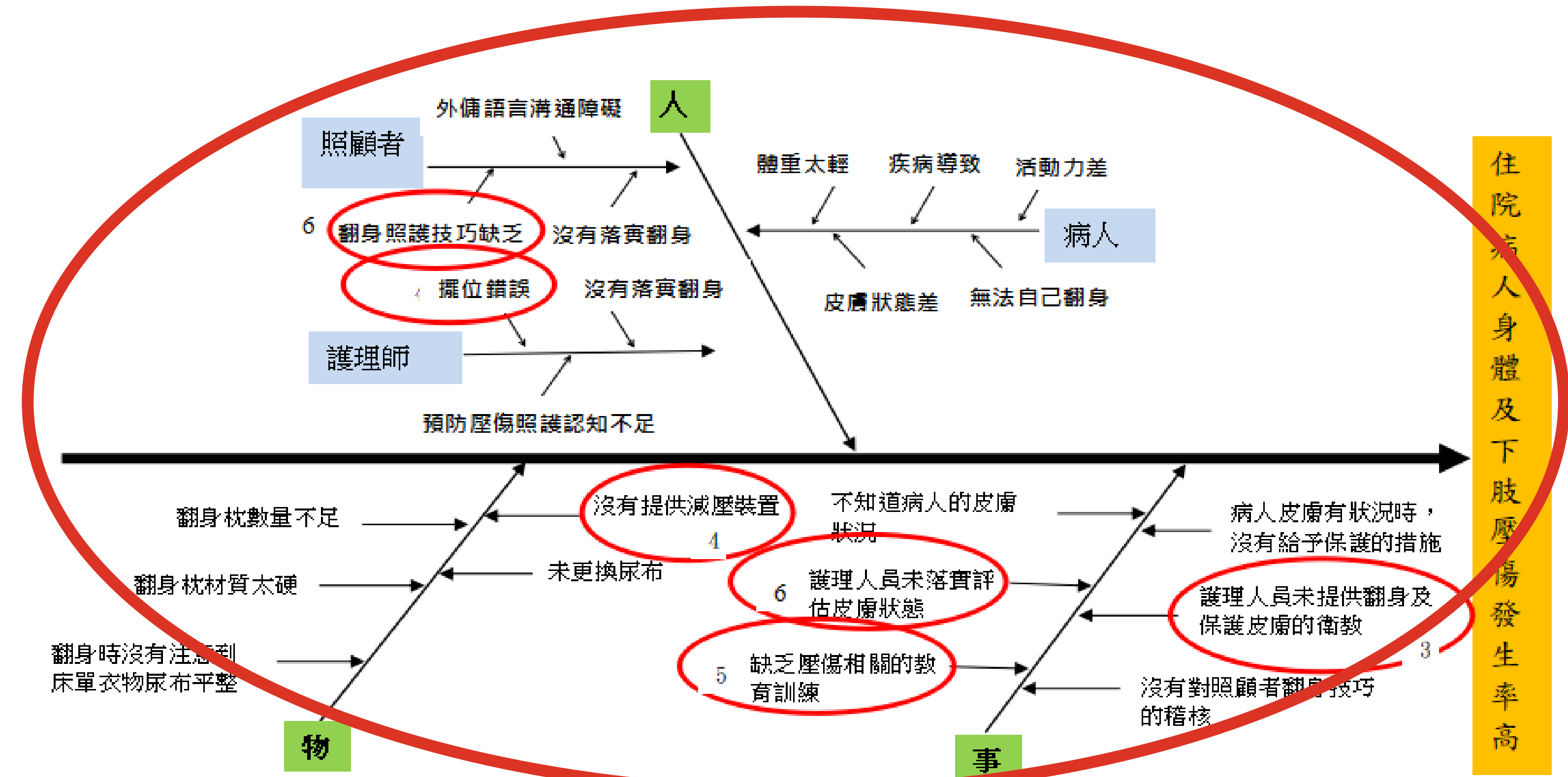
圖一 住院病人身體及下肢壓傷發生率高之特性要因圖