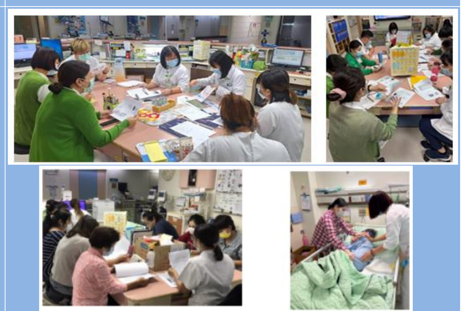
辦理壓傷護理照護相關宣導